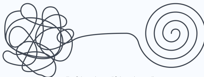
Fra fakturakaos til fakturakontroll

Ocab er en av Nordens største leverandører av bygg- og skadeservice med avdelinger i både Norge, Sverige, Finland og Danmark.